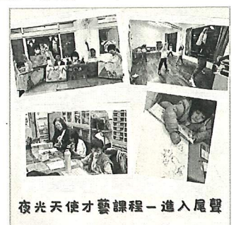
夜光天使才藝課程—進入尾聲